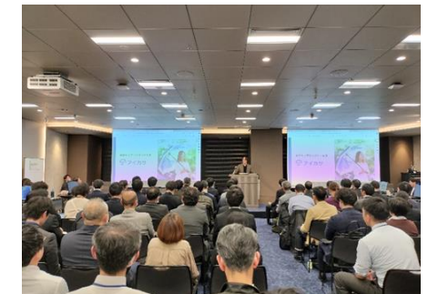
【第5回サロン 開催中の様子】