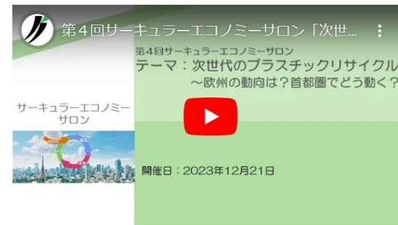
【第4回サロン 一部アーカイブ配信実施】