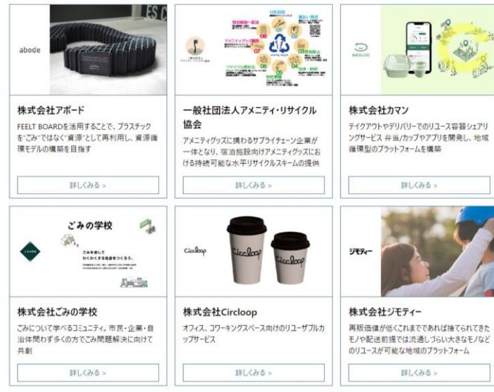
【TOKYOサーキュラーエコノミーアクション 企業の取り組み紹介ページ】